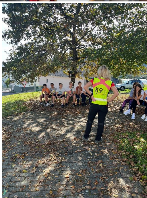
TIM ZA PRIPRAVO KD