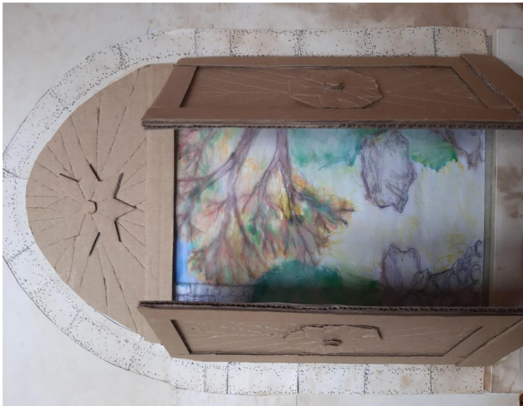
Tereza Zupet, 9. a