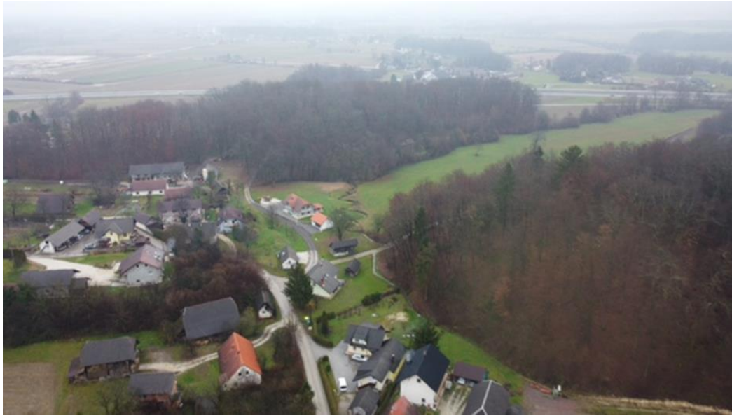
TOMAŽJA VAS – Ema Medved, 9. a