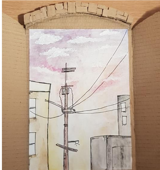
Blažka Lesjak, 9. a