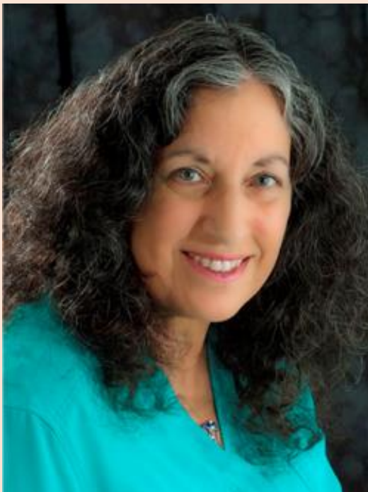
pesnica Margarita Engle