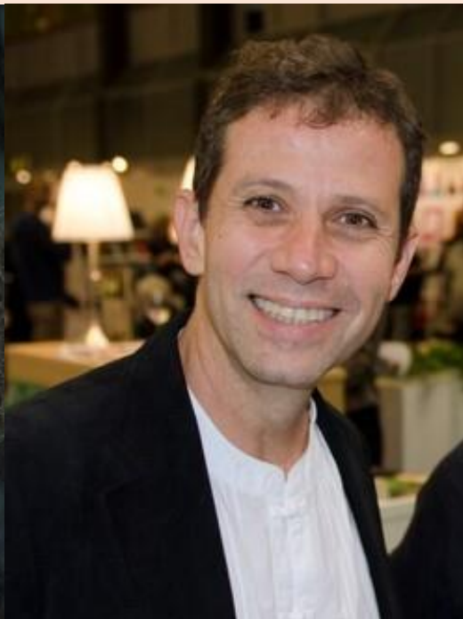
ilustrator Roger Mello